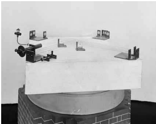
Abb. 3 Modell des Michelson-Morley-Interferometers

oder gegen die Erdbewegung ausbreitet. Die Interferometer-Experimente bestehen also im Wesentlichen darin, die Apparatur gegen die Erdbewegung zu drehen, in der Hoffnung, dabei entsprechende Interferenzveränderungen zu entdecken.