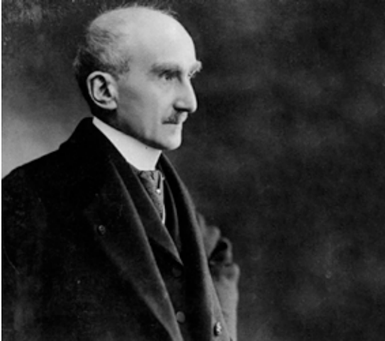
Abb. 1 Henri Bergson, 1922

Beschäftigt sich Philosophie mit Physik, gilt ihr Engagement selten den Formeln, Diagrammen oder Experimentalapparaturen der Naturwissenschaft. Worauf sie sich in der Regel konzentriert, ist die Interpretation physikalischer Aussagen und Begriffe. Dauer und Gleichzeitigkeit verfolgt die genau gegenteilige Strategie: Das Buch, das 1922 in Paris erscheint, erhebt die physikalischen Instrumente und mathematischen Verfahren der Relativitätstheorie sowohl zum Ausgangspunkt als auch zum Argument philosophischer Reflexion. Dies mag auf den ersten Blick ein gewisses Hindernis bei der Lektüre dieses Buches darstellen – wobei man sich davon nicht abschrecken lassen sollte. Größtenteils nämlich spielen die mathematischen Ausdrücke mögliche Aussagen der immer gleichen Formeln und Diagramme durch, die das Gerüst der speziellen Relativitätstheorie bilden.